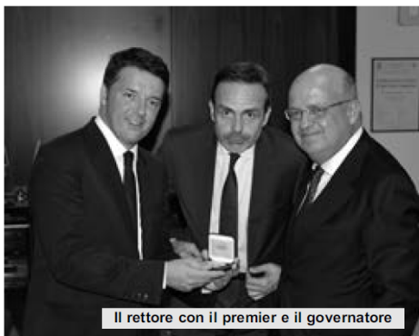
Il rettore con il premier e il governatore